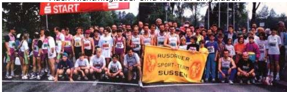
Ein Highlight in unserem Vereinsleben: Beim 5. Staufermarathon 1994 kamen 94 von 973 Startern aus unseren Reihen

Wir freuen uns über Jede/n der beim Filslauf mitmacht Auch Nichtmitglieder sind herzlich eingeladen